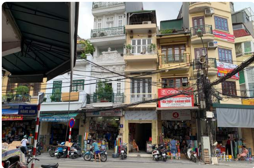
Hình 1. Các cửa hàng sơn dọc phố sơn Hàng Hòm nổi tiếng ở Hà Nội.

theo Quyết định số 1548/QĐ-BYT ngày 10/5/2012 của Bộ trưởng Bộ Y tế về việc ban hành hướng dẫn chẩn đoán và điều trị ngộ độc chì 4 (trẻ em bị nhiễm độc chì khi có nồng độ chì máu > 10\mu\text{g/dL} ), cụ thể như sau: