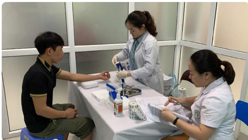
Hình 4. Lấy mẫu máu thọc son để phân tích chì máu.